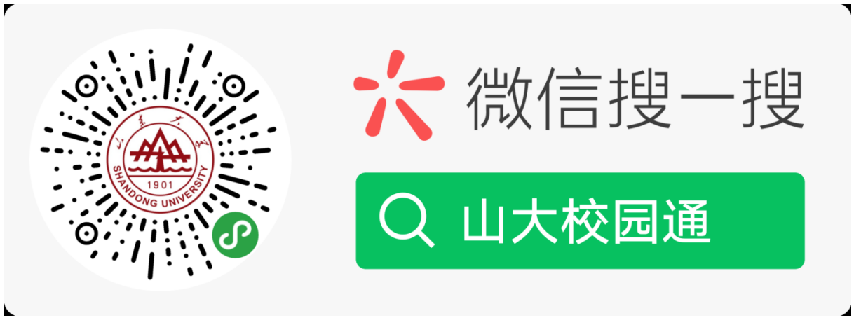
图 1 关注“山大校园通”