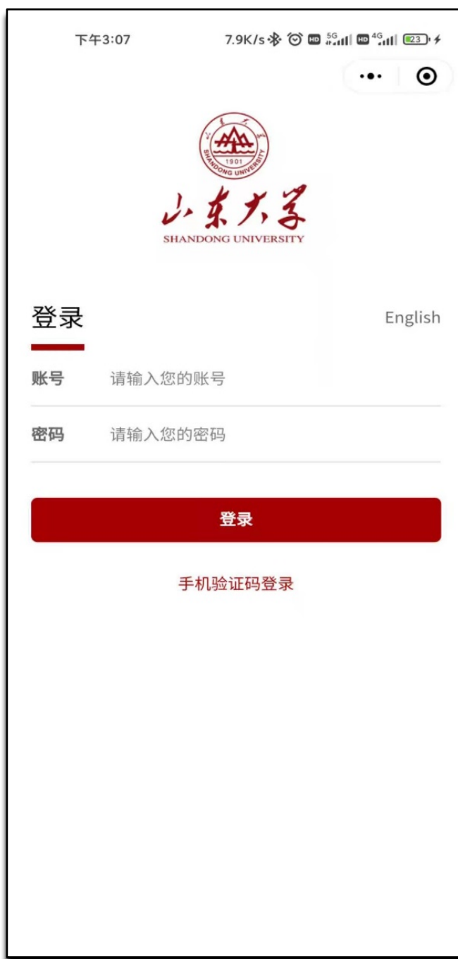
图 2 身份绑定

进入山大校园通小程序，首先进入的是-【统一认证】绑定页面，须输入统一身份认证账号及密码。